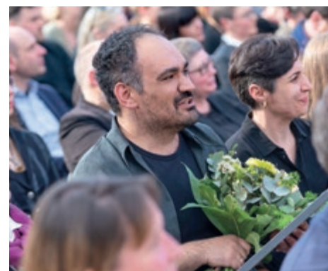
Dinçer Güçyeter, Gewinner des Preises der Leipziger Buchmesse 2023 in der Kategorie Belletristik

Begründung der Jury: Traditionell wie innovativ queer erzählt, reißt einen diese Einwanderergeschichte mit ihrer Emotionalität und großen politischen Bedeutung von Anfang an mit. Der Roman blickt auf deutsche und europäische Verhältnisse, lässt die Worte zum Himmel fliegen, spart aber gleichzeitig die Demütigungen am Boden nicht aus. (...)