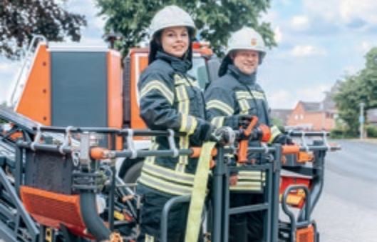
Freiwillige Feuerwehr Nettetal, Preisträger 2022