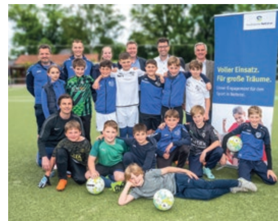
Die Kinder und Trainer der Fußball E1 Jugend vom SC Rhenania Hinsbeck freuen sich über die Sportförderung

Voraussetzung für eine Förderung ist die Mitgliedschaft des Sportvereins im Stadtsportverband. Zudem müssen mindestens zwanzig Prozent der gemeldeten Mitglieder unter 18 Jahren sein. Die Höhe der Förde-