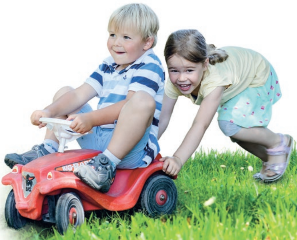
Kinder der Katholischen Tages- einrichtung St. Lambertus Leuth, Preisträger 2020