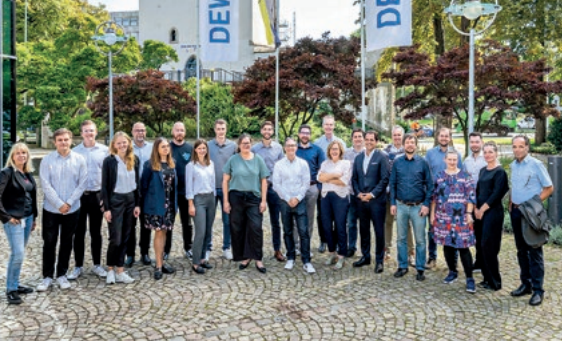
Im September trafen sich die Klimawerke zum sechsten Netzwerktreffen in Dortmund