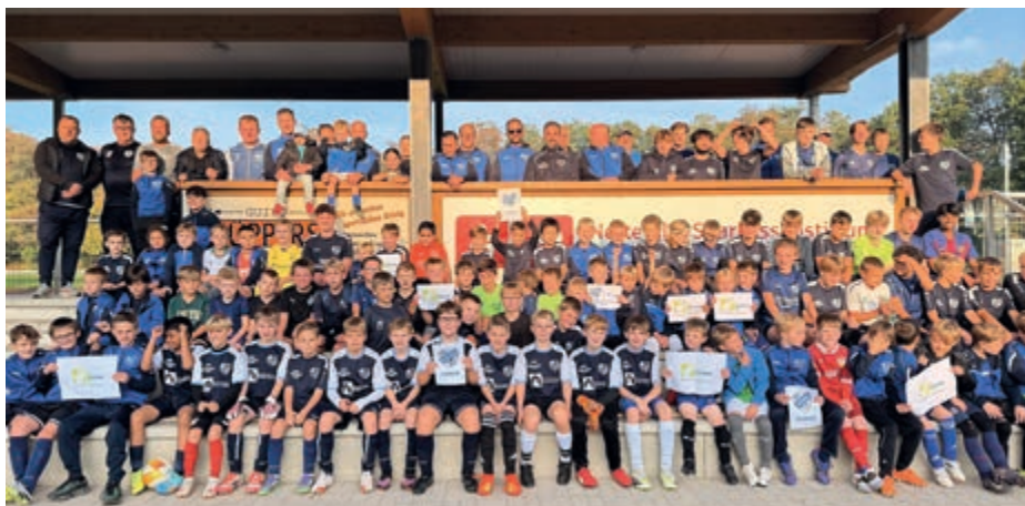
Die Kinder und Jugendlichen vom SC Rhenania Hinsbeck freuen sich über den ersten Platz und 2.500 Euro Preisgeld

Der Wettbewerb unterstützt lokale Initiativen, Vereine und Organisationen und ermöglicht es den Siegern, ihre wichtigen Projekte voranzutreiben. Die zehn Bewerber mit den meisten Stimmen werden mit einem Preisgeld für ihr Engagement belohnt. Die Bestplatzierten erhalten 2.500 Euro Preisgeld, die Zweitplatzierten 2.000 Euro, der Gewinner vom dritten Platz 1.500 Euro und vom vierten Platz 1.000 Euro. Der fünfte bis zehnte Platz wird mit jeweils 500 Euro gefördert. Welche Initiativen gefördert werden, entscheidet das Publikum über die Stimmabgabe. Mit großer