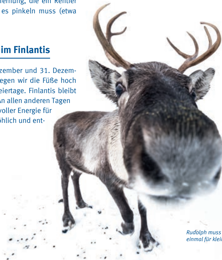
Rudolph muss alle 7,5 Kilometer einmal für kleine Rentiere